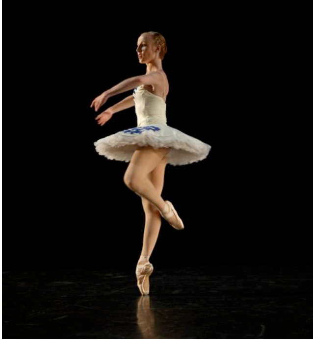
Variation aus „Le Corsaire”