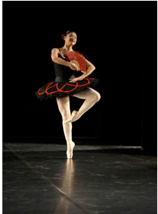
Variation aus „Don Quixote“