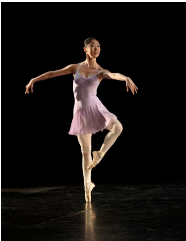
Variation aus „Tschaikovsky Pas de deux”