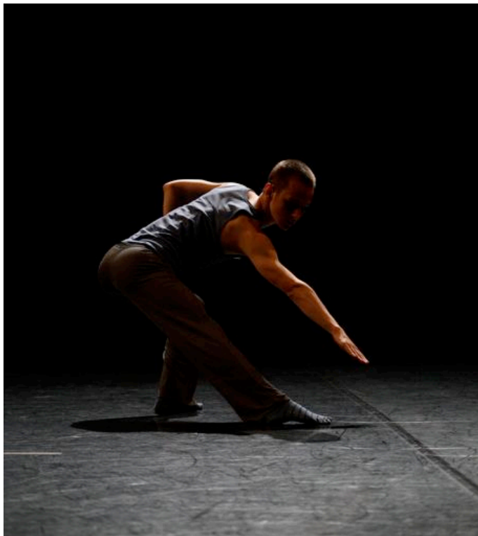
„The Vile Parody of Address“