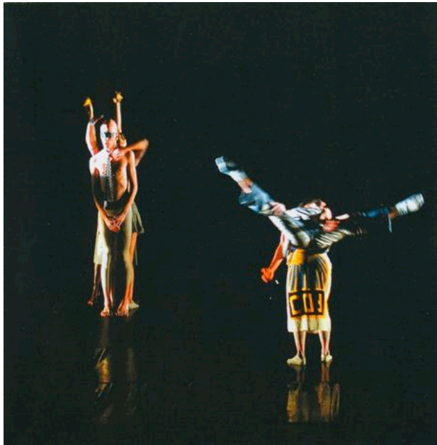
Subkutane Elegie Choreographie: Dieter Heitkamp