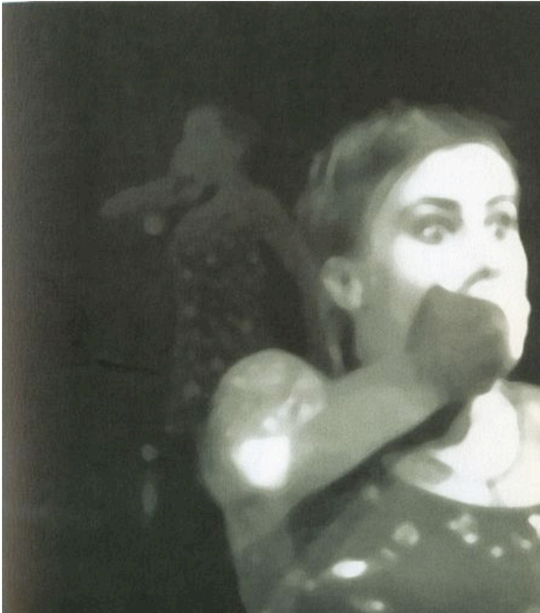
LA SERVA PADRONA