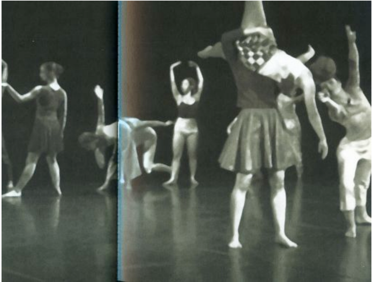
ORPHEUS REMIX 2