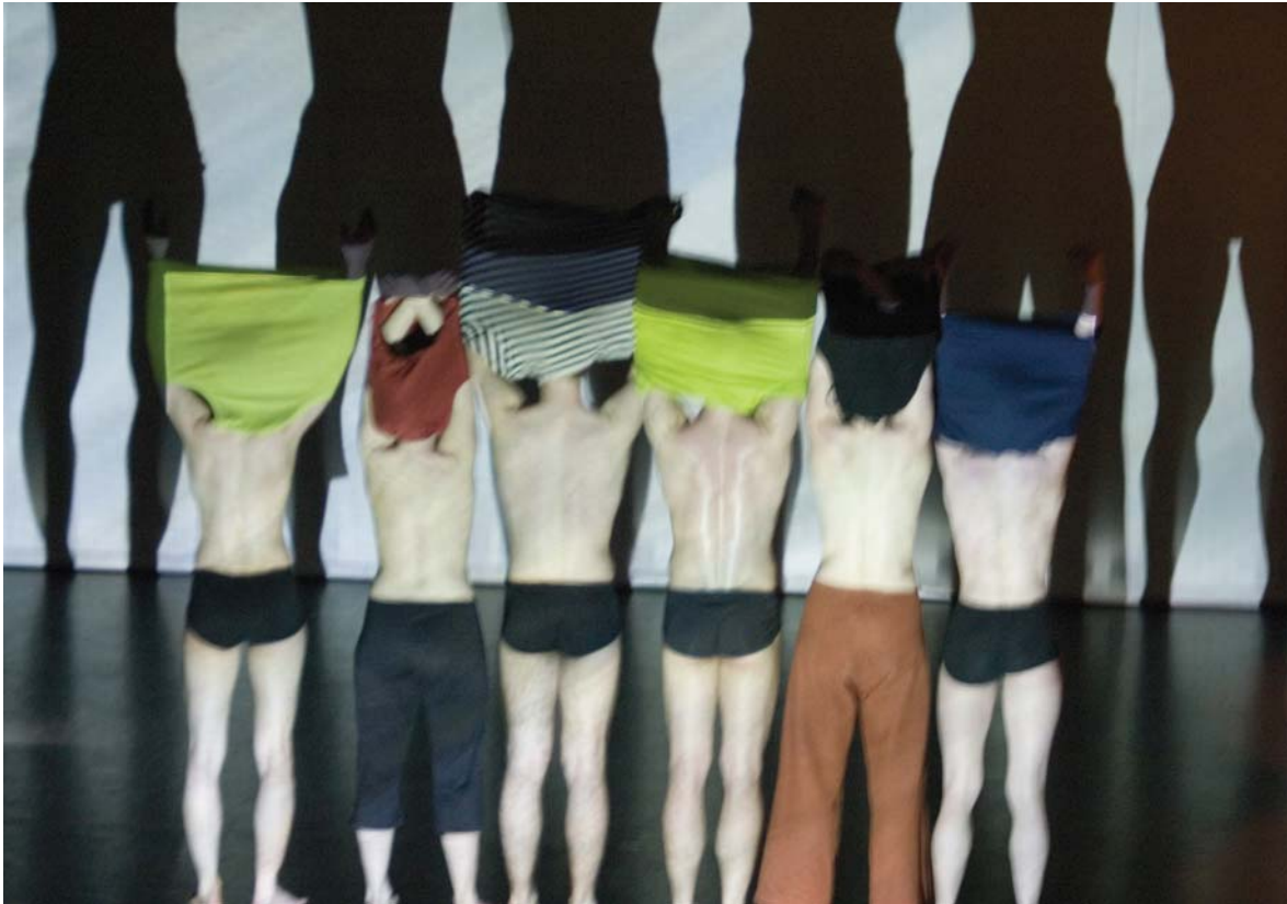
Lecture Performance – Hautsache Bewegung Dieter Heitkamp