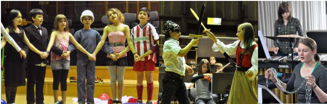
1. Preise: Holzhausenschule (Frankfurt), Immanuel-Kant-Schule (Rüsselsheim), Lessing-Gymnasium (Lampertheim)

Hochschule für Musik und Darstellende Kunst Frankfurt am Main