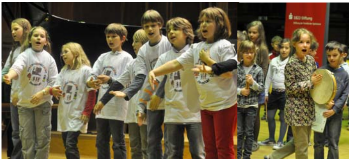
2. Preise: Holzhausenschule (Frankfurt), Zentgrafenschule (Frankfurt)