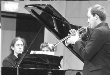
Stipendiaten gestalteten das Konzert zum Jahrestreffen der Gesellschaft der Freunde und Förderer (links und oben).