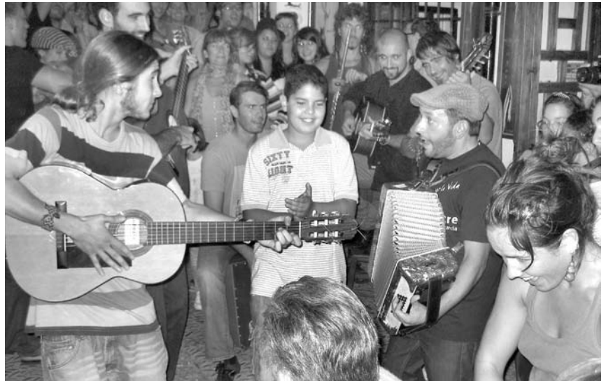
Typische Straßenszene im abendlichen Granada: Menschen finden sich zum spontanen Musizieren zusammen und genießen das Temperament der Musik.

Eine ganz wunderbare Stimmung ist das, die ich in Granada erleben durfte. Für ein Jahr studierte ich hier spanische Philologie und Literatur an der Universidad de Granada und genoss das spanische Leben in vollen Zügen. Ursprünglich war ich über die Frankfurter Uni als ERASMUS-Studentin in Granada, hatte aber nach langem Nachfragen nun endlich auch die Möglichkeit bekommen, Unterricht an der Musikhochschule zu erhalten: am Conservatorio Superior de Música Victoria Eugenia de Granada . Im Prinzip läuft hier alles genauso ab wie bei uns an der