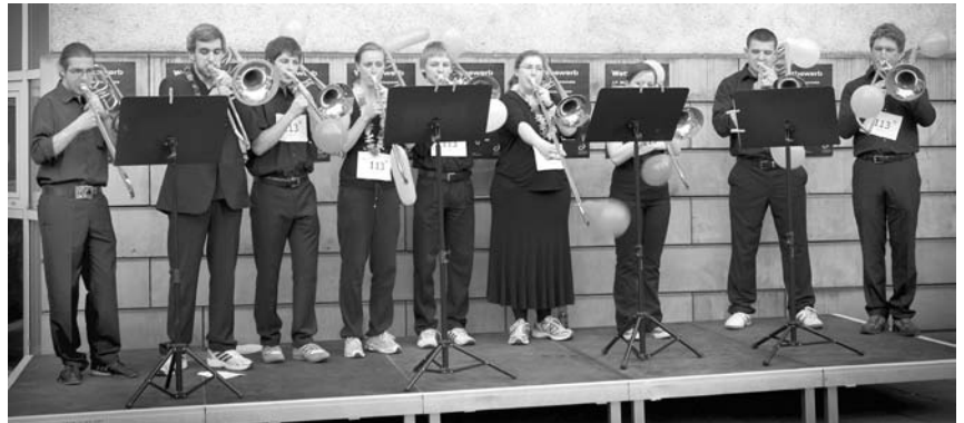
Als „Trombumbas“ hatte sich ein Posaunen-Nonett zum Wettbewerb vor dem HfMDK-Eingang angemeldet. Es lieferte einen feurigen zehnmütigen Beitrag.