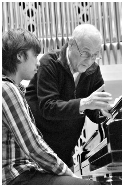
Mit Studierenden auf der Suche nach musikalischer Wahrheit: Ferenc Rados unterrichtete vier Tage lang eine „Master Class“ im Kleinen Saal der Hochschule.

das den Zugang zur musikalischen Aussage verklebt, als „der blutige Kadaver der Technik“ geschmäht und in seinem Unterricht ebenso wenig geduldet wird wie ein Spiel, das nicht auf einem natürlichen Muskelgefühl gründet und nicht der „Wahrheit“ dient. Die Töne und deren Sinn, nicht Sechzehntel und Fingersätze, sind es, weswegen wir das Instrument spielen, mit Händen, die „atmen“ und nicht nur die Tasten niederpressen. Dass Rados nicht als Pädagoge des übertriebenen Lobs gilt, wurde allen Teilnehmern schnell bewusst. Auf nicht gerade häufige Kommentare