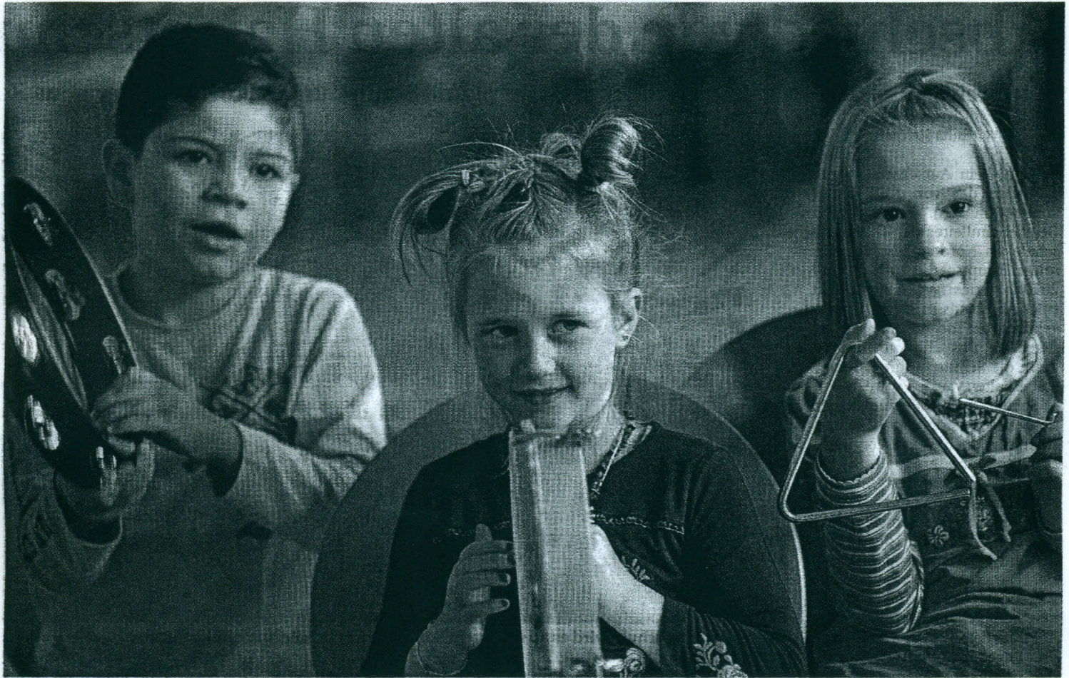
Melodien erzählen Geschichten, die den ganz jungen Menschen eine neue Welt eröffnen können.

Hochschule für Musik und Darstellende Kunst Frankfurt am Main